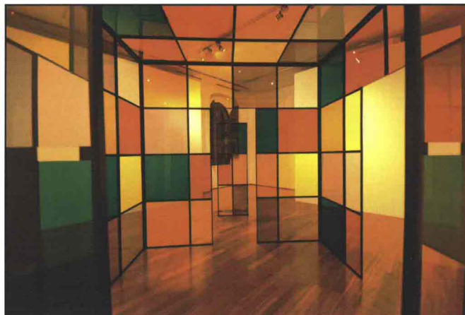
in basso: Daniel Buren, La Cabane , plexiglas